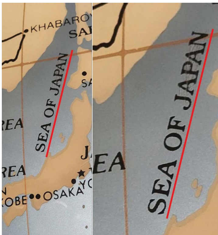
그리니치 천문대 내 대형 지구본의 일본해 표기

서 교수는 또 “일본해 표기 지도를 발견하게 되면 해당 기관에 일본해가 아니라 동해 표기가 맞는지에 대한 항의 메일을 당당히 보내는 것이 좋다”고 조언했다.