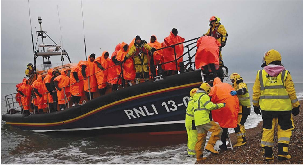
영불해협을 건너다 구조된 이주민들